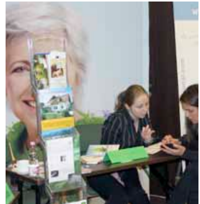
A Környezetbarát Termék Nonprofit Kft. kiállítóstandja az eseményen

A konferencia előadásait sajtótájékoztató követte, amelyen a TV2 két sztárvendége, Kandász Andrea és Váczi Gergő is részt vett, majd a Clean Europe 2013 szakmai vetélkedő döntőjére és díjkiosztójára került sor.