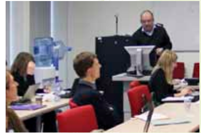
Paul Vaughan, az angol Illetékes Testület vezetője a 2013 tavaszán indult projekt eredményeit ismerteti

A projekt bemutatása után érdekes és interaktív csapatmunkát kezdeményezett Jakob Wegener, a korábbi elnök: a résztvevő szakértők csapatokba rendeződtek, és válaszolták meg a különböző esettanulmányokkal kapcsolatos kérdéseket. A magyar csapat feladata volt megválaszolni, hogy mit kell tenni abban az esetben, amikor egy cég több tagállamban is gyártást folytat. A szakértői csapat tapasztalt kollégákból állt, úgymint a finn Illetékes testület, az Északi Hattyú rendszer egyik vezető szakembere és a cseh Illetékes Testület képviselője, ezért a válaszadás minden nehézség nélkül zajlott.