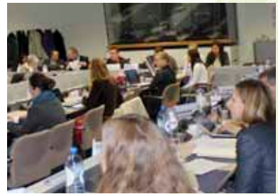
Előkészületben az új uniós feltételrendszerek

Az ágymatrac feltételrendszert ugyancsak a JRC kollégája ismertette, amelyben a gyulladásgátlók és a poliuretán összetevő izocianát hányada bizonyult a két kardinális kérdésnek.