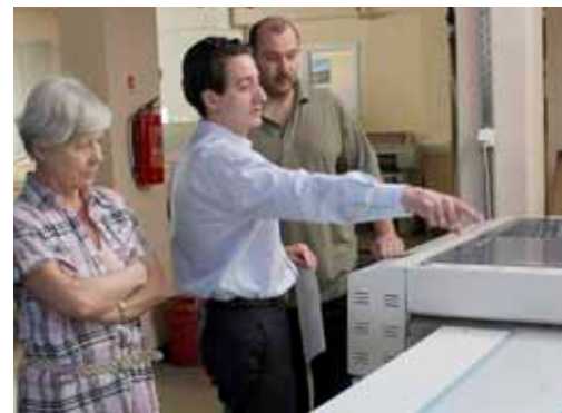
Ellenőrzési szemlén a Zrínyi Nyomdában

– Természetesen, igen. Dániában éppen az elmúlt évben merült fel egy olyan törvénytervezet elfogadása, amely szerint azon nyomdaipari termékeket, amelyek nem rendelkeznek ökocímkével egy extraadó sújtaná. Mivel számunkra a dán piac nagyon fontos, elhatároztuk, hogy megszerezzük az Európai Unió ökocímkejét. És annak ellenére, hogy Dániában ezt a törvényjavaslatot még nem szavazták meg, már találkoztunk olyan árajánlatkéréssel, ahol az elvárások között szerepelt, hogy a pályázó nyomdának legyen ökocímke minősítése. Ez egy nagyon fontos kritérium, és mivel ennek még a kelet-európai régióban is kevés nyomda tud megfelelni, így némi előnyt