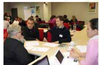
A finn, német, cseh és a magyar ökocímkező szervezetek képviselői tanácskozás közben