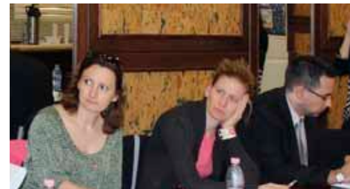
A tréninget elvégzők képet kaptak a zöld beszerzésekben rejlő gazdasági, környezetvédelmi és kommunikációs előnyökről is

További információk: www.buy-smart.info/hungarian/buysmart-projekt