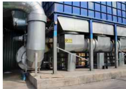
A Zrínyi Nyomda Zrt. kiemelt figyelmet fordít a szelektív hulladékkezelésre és újrahasznosításra

– A papírhulladékot szelektíven gyűjtjük, és különböző szelektációs ismervek alapján igyekszünk a lehető legjobban szétválasztani és újrahasznosítani, annak érdekében, hogy az a lehető legkevésbé legyen terhelő a környezet számára. A hulladékkezelésre használt elszívórendszerünk azonnal szétválasztja a különböző selejteket, illetve a gyártás folyamán keletkező terméket. Leszerződöttünk egy német céggel, amely a különböző típusú már szétválogatott hulladékterméket elszállítja tőlünk és Németországban újra feldolgozza. Ez visszakerül a papírgyárakba, ahonnan mi megvásároljuk a kész papírterméket. Azaz a selejtből újra alapanyag lesz, hozzánk pedig a legyártott kész papírtekercs kerül vissza, ezáltal biztosítani tudjuk, hogy a legkisebb környezetterhelés történjen meg. Az általunk használt papírok 50–80 és 100 százalékban újrahasznosítottak. A folyamat során mindent újrahasznosítunk, amit csak lehet. Hogy az általunk gyártott szőlápoknak a szelektív visszagyűjtése például az üzletekben, mikor történik majd meg, az még a jövő kérdése. Természetesen az is előrelépés, ha a fogyasztók a szőlápokat a lakossági szelektív papírgyűjtőbe dobják be.