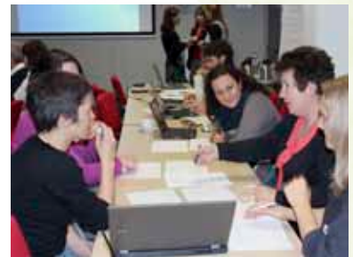
Az előadást interaktív csapatmunka követte