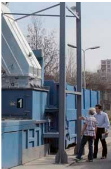
Speciális elszívőrendszert használnak a hulladékkezelésre