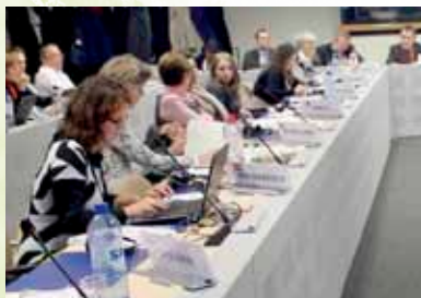
Az Európai Unió Ökocímke Bizottságának ülésén